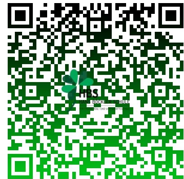
QR Code mit Link zum Infoabend