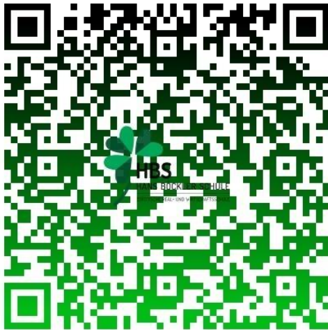
QR Code mit Link zum Infoabend